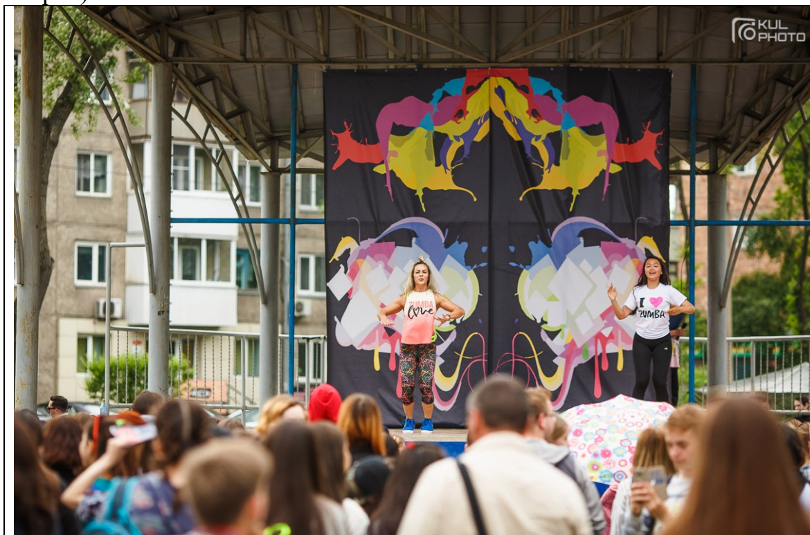
Проект «Здравствуй» в действии: «Танцы большого города», приуроченные ко Всемирному дню без табака, состоялись в Черногогорском парке 30 мая 2017 г.

тиражом 1 тыс. экз., видеоролик, размещенный в сети Интернет (свыше 1,5 тыс. просмотров).