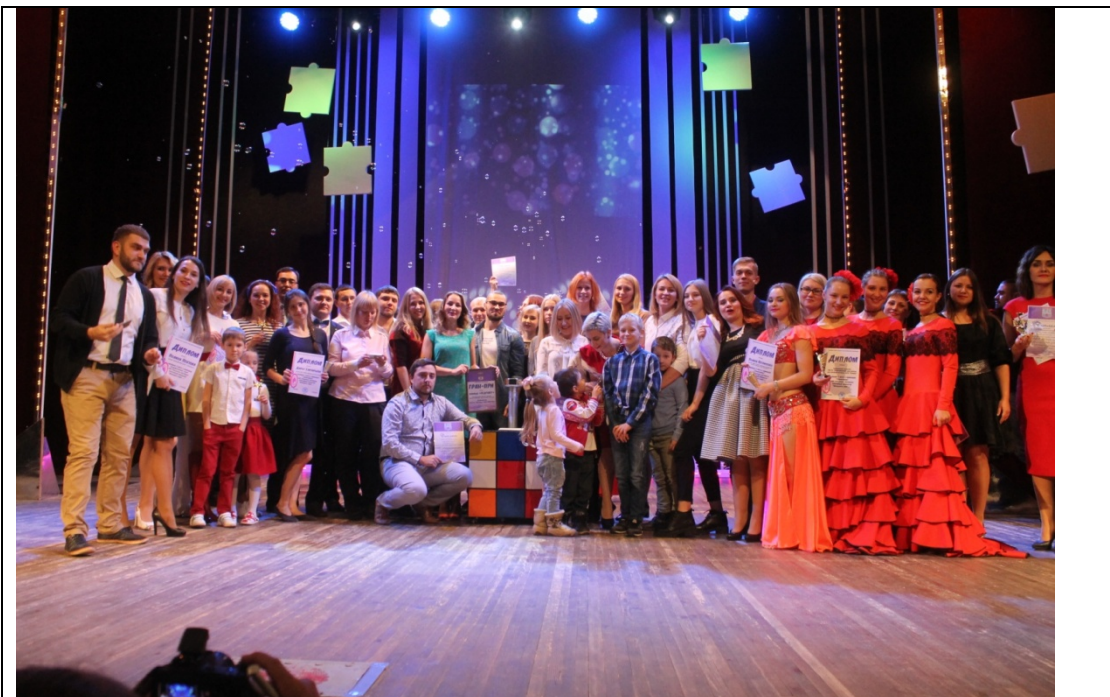
Победители и призеры XIII Городского фестиваля работающей молодежи «Молодость плюс...», 26 октября 2017 г.

Проект «МИР» (Молодежные информационные ресурсы). Отделом молодежи проведена большая работа по освещению проектов и мероприятий в средствах массовой информации и информационно-коммуникационной сети «Интернет», в т.ч. через сайт «молодежь.абакан.рф». Партнерами в данном проекте выступают ИРТА «Абакан» и другие теле-радио-компании: «РТС», «Юг Сибири», «ВГТРК», радиостанции: «Дорожное радио» и «DFM». Особо следует выделить выпуски «Молодежной программы» на телевизионном канале «ГНТ-Абакан». В социальных сетях Vkontakte и Instagram в доступной и яркой форме размещены фото-, видеоматериалы, проводятся информационные акции, репосты обеспечивают распространение информации на более широкую аудиторию подписчиков. В группе «Отдел молодежи» Vkontakte на начало отчетного года было зарегистрировано 2240 чел. - в течение года добавились более 2 тыс. чел., сегодня в группе - 4 515 подписчиков.